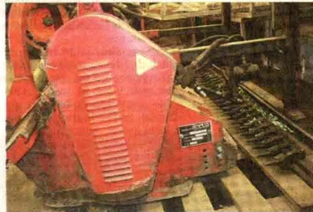
Eine eigenkonstruierte Kombination: Sträucher-Schlegelmulcher mit Mähbalken. Die Sträucher werden auf 15 bis 20 Zentimeter gekürzt, das Schnittgut so klein gehäckselt, dass es liegen bleiben kann, der nachlaufende Mähbalken sorgt anschließend noch einmal für einen geraden Schnitt.

Schweden insgesamt zu einer dominierenden Kultur geworden. Zu den Hauptkunden der Forstbaumschule gehören Privatwaldbesitzer, Kommunen, die Länder und der Bund, in dieser Reihenfolge. Früher war das mal umgekehrt. Wichtige deutsche Abnehmer sind die Braun- und Steinkohlewerke in West und Ost, in Schweden sind es private und staatliche Waldgesellschaften. Europa weit wird sowohl direkt als auch an Zwischenhändler vermarktet. Weitere wichtige Abnehmerländer sind Ungarn, Tschechien und Irland.