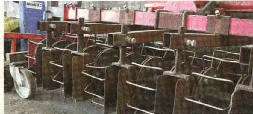
Mit dem Anbringen der Zwischenbleche wurde die Funktionsweise der Bügelhacke im Betrieb Schrader verbessert.

Die Betriebsausstattung der Firma Rudolf Schrader orientiert sich an den Erfordernissen der Forstpflanzenvermehrung. So ist ein Kühlhaus für die gerodeten Pflanzen ein absolutes Muss. In Kölln-Reisiek hat es eine Größe von 1 200 Kubikmetern (400 Quadratmeter bei drei Metern Höhe), ergänzt durch zwei kleinere Kühlhäuser für das Saatgut.