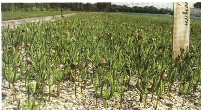
Neue Aussaaten von Abies nordmannia.